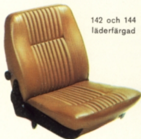
142 och 144 läderfärgad