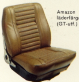
Amazon läderfärgad (GT-utf.)