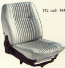
142 och 144/vit