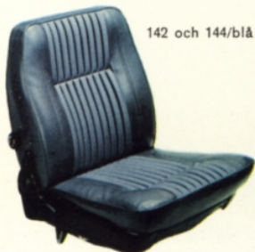
142 och 144/blå