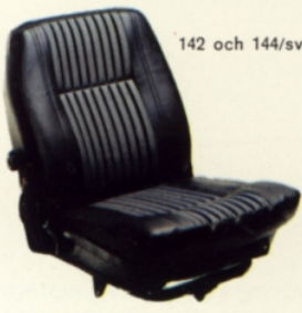
142 och 144/svart