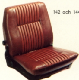
142 och 144/röd