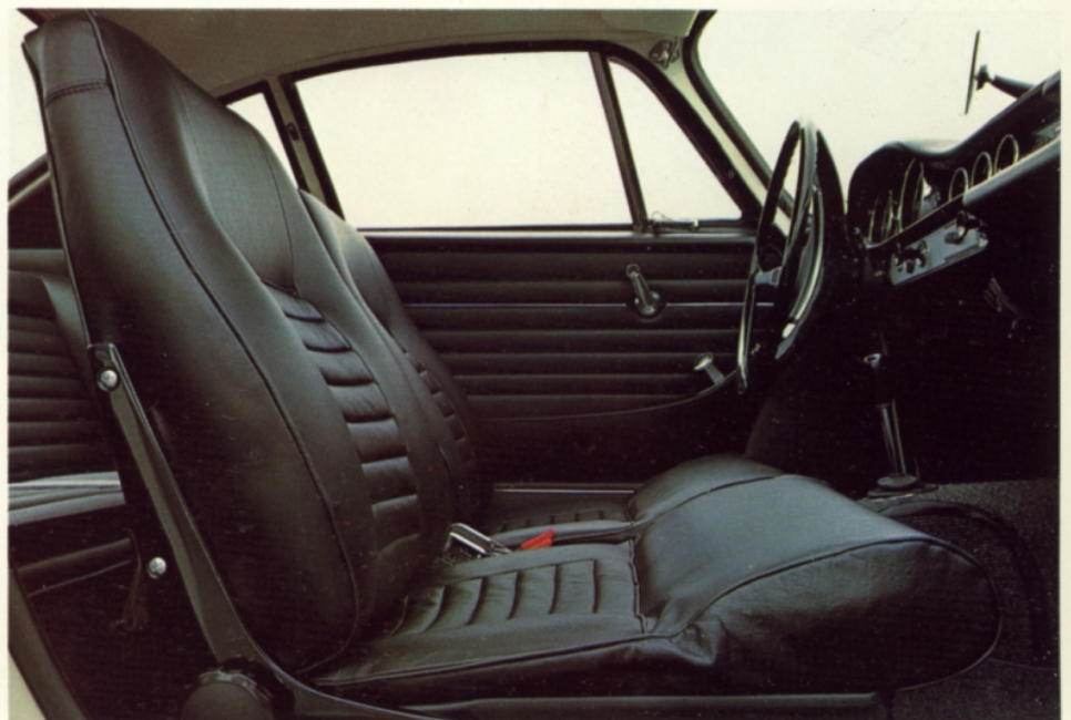
Volvo 1800 S