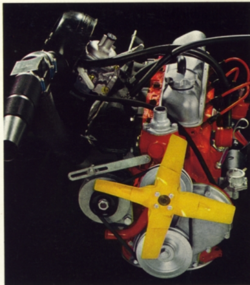
B 20 A. 2 liters, 4-cylindrig. 90 hk SAE. Avgasrening som standard.

Volvos kvalitet och slitstyrka bidrar till låga bilkostnader och högt andrahandsvärde. Dessutom har Volvo 164, 140-serien och Amazonmodellerna Volvos 5-åriga PV-garanti — ingen extra kostnad för vagnskadeförsäkring. Alla Volvo-ägare har dessutom tillgång till speciella försäkringsförmåner genom Volvia, Volvos eget försäkringsbolag.