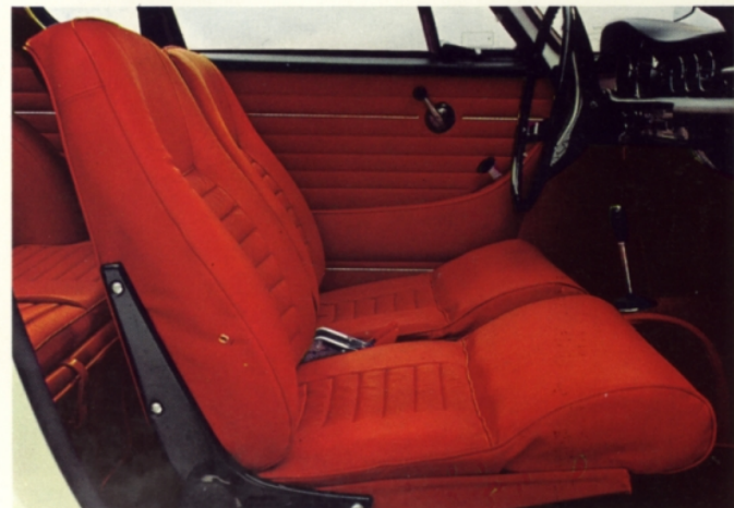
Volvo 1800 S