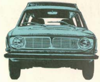
Volvo 145 Express 5-dörrars, 90 hk SAE