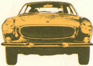
Volvo 1800 ES 3-dörrars, 135 hk SAE, elektronikstyrd bränsleinsprutning