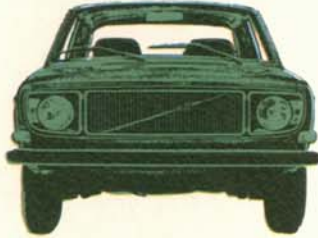
Volvo 144 de Luxe 4-dörrars, 90 eller 110 hk SAE