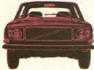
Volvo 142 de Luxe 2-dörrars, 90 eller 110 hk SAE