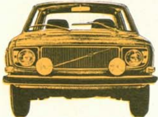
Volvo 142 Grand Luxe 2-dörrars, 135 hk SAE, elektronikstyrd bränsleinsprutning