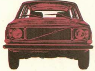
Volvo 145 de Luxe 5-dörrars, 110 hk SAE