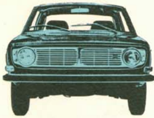
Volvo 142 2-dörrars, 90 hk SAE