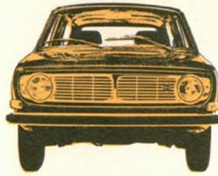
Volvo 145 Herrgårdsvagn 5-dörrars, 90 hk SAE