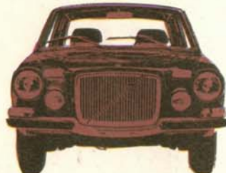
Volvo 164 4-dörrars, 145 hk SAE