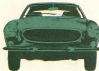
Volvo 1800 E 2-dörrars, 135 hk SAE, elektronikstyrd bränsleinsprutning