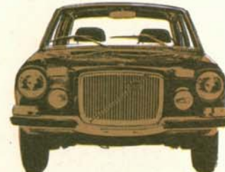
Volvo 164 E 4-dörrars, 175 hk SAE, elektronikstyrd bränsleinsprutning