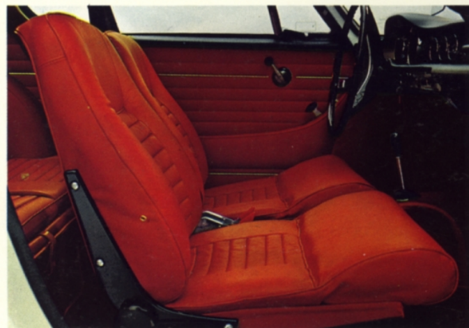
Volvo 1800 S