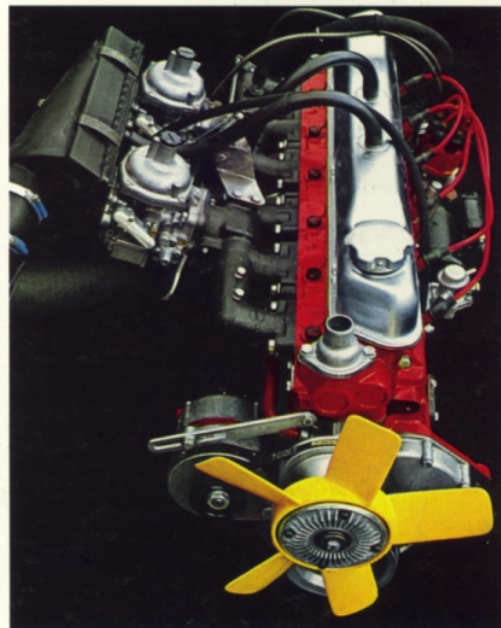
B 30. 3 liters, 6-cylindrig. 145 hk SAE. Avgasrening som standard.