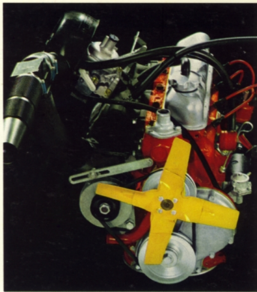
B 20 A. 2 liters, 4-cylindrig. 90 hk SAE. Avgasrening som standard.

Volvos kvalitet och slitstyrka bidrar till låga bilkostnader och högt andrahandsvärde. Dessutom har Volvo 164, 140-serien och Amazonmodellerna Volvos 5-åriga PV-garanti — ingen extra kostnad för vagnskadeförsäkring. Alla Volvo-ägare har dessutom tillgång till speciella försäkringsförmåner genom Volvia, Volvos eget försäkringsbolag.