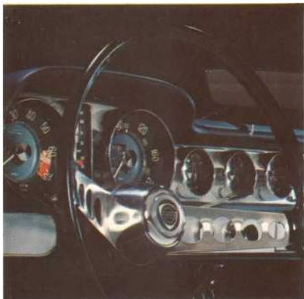
Het instrumentenpaneel is volledig

De wegligging is een klasse apart en hierdoor rijdt men veilig en comfortabel over alle soorten wegen. De gordelbanden zijn bestand tegen het lang achtereen rijden met hoge snelheden en dragen bij tot de hitstekende wegligging.