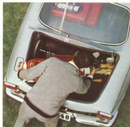
Een voor dit type wagen ongewoon grote bagageruimte.