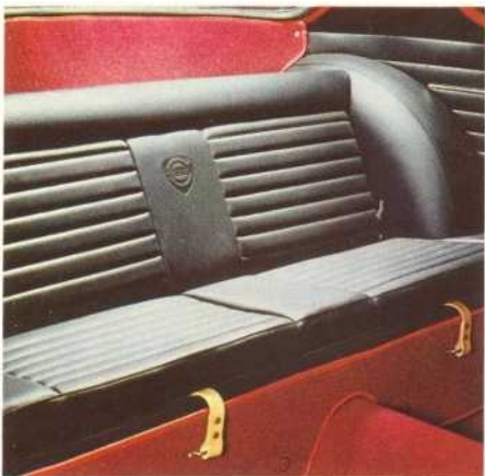
Achter zijn twee extra zittingen. Met neergeklapte achterleuning wordt er ruimte voor bagage gemaakt.