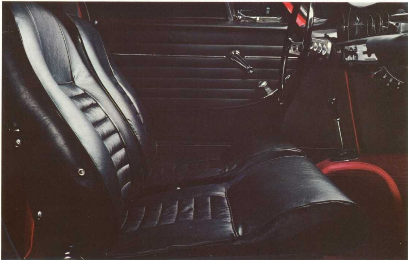
Geriefelijke, met leer beklede stoelen. Geheel verstelbaar. Ook de stand van het lendensteuntje kan veranderd worden.